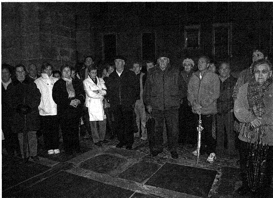
CIERRE DE LAS CONCENTRACIONES EN LOS ARCOS. La localidad de Los Arcos fue ayer una de las últimas en celebrar concentraciones de condena, ayer a las 20 horas. A ella asistieron 200 personas. MONTXO A.G.