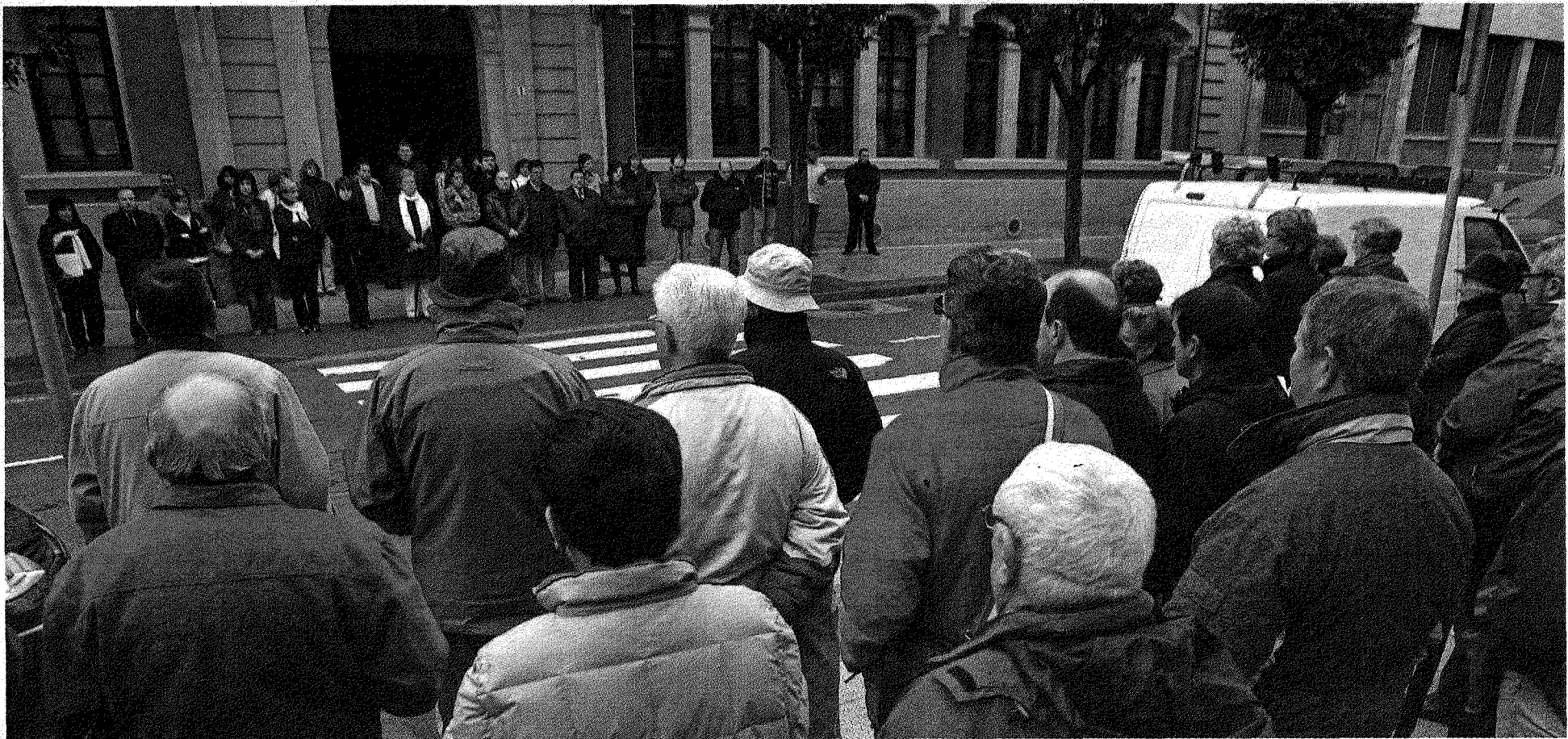
SEGUNDA CONCENTRACIÓN EN LA CIUDAD DEL EGA. Cerca de 150 vecinos siguieron ayer en Estella la concentración convocada por el Ayuntamiento, la segunda en 48 horas, puesto que vecinos por la Paz realizó la su convocatoria hacia los estelenses el pasado sábado a las ocho de la tarde. MONTXO A.G.