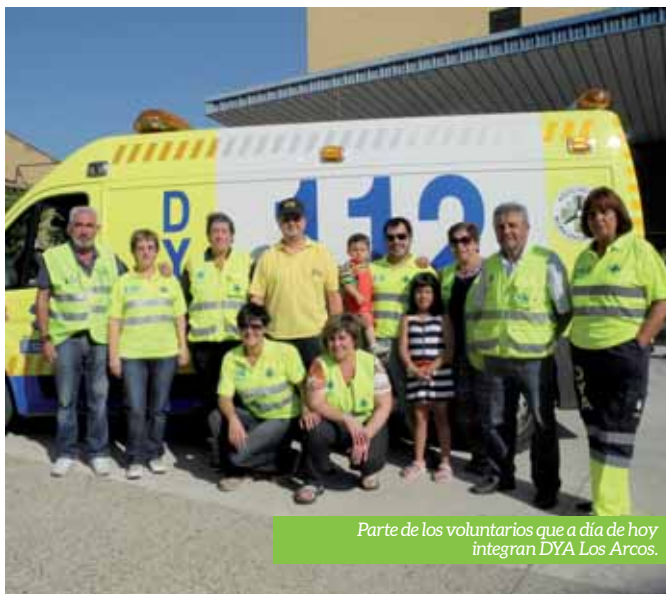
Parte de los voluntarios que a día de hoy integran DYA Los Arcos.

Los integrantes de Base 8 DYA Navarra destacan la ayuda de los socios colaboradores, puesto que gracias a ellos, junto a los Ayuntamientos, se puede mantener la ONG.