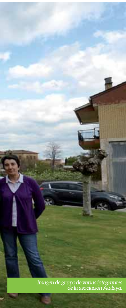
Imagen de grupo de varias integrantes de la asociación Atalaya.

La asociación Recreativa, Cultural y Deportiva Atalaya está de celebración; este 2014 cumple 25 años, que han servido para animar la vida cultural arqueña, y el tiempo libre de sus jóvenes, mediante la organización de diferentes actividades.