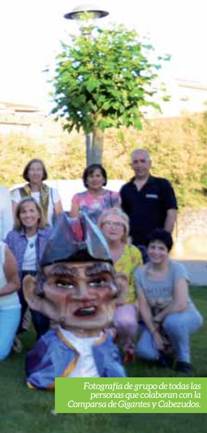
Fotografía de grupo de todas las personas que colaboran con la Comparsa de Gigantes y Cabezudos.

Así, este año será un recuerdo y agradecimiento a todas las personas que han pasado por la Comparsa, al mismo tiempo que se seguirá realizando con ilusión lo que tantos años llevan haciendo: preparar los personajes, bailar al son de la música y disfrutar. _