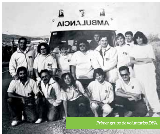
Primer grupo de voluntarios DYA.

Su zona de cobertura es el perímetro del municipio arqueño: Viana, Meano, Genevilla, Santa Cruz de Campezo, Acedo, Ancín, Murieta, Estella, Allo, Lerín, Lodosa, Sartaguda, San Adrián y Mendavia. Sin embargo, en grandes catástrofes, han aumentado su rango de cobertura acudiendo a los