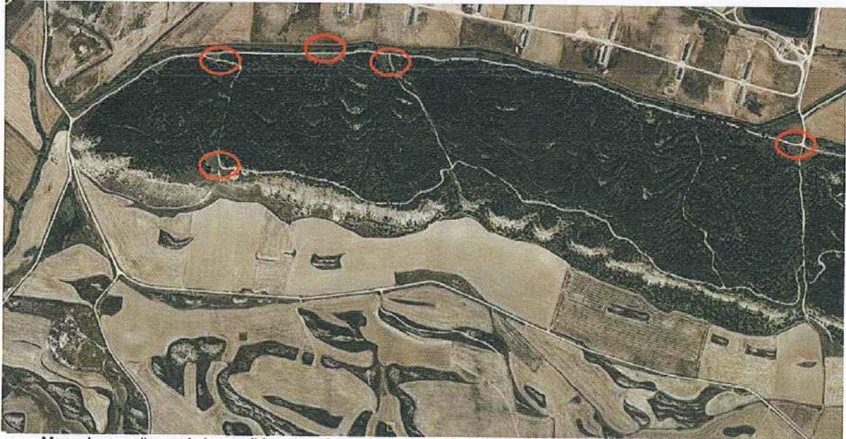
Marcado con elipse roja los posibles cargaderos dentro de la explotación.

En cualquier caso el adjudicatario vendrá obligado a reparar los daños que se produzcan en pistas, vías, cargaderos y cierres.