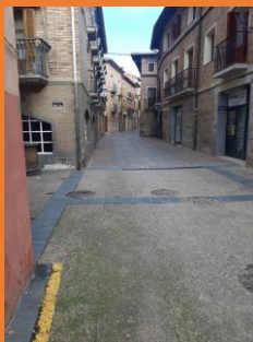
Calle Ramón y Cajal