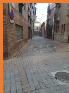
Calle del Hospital