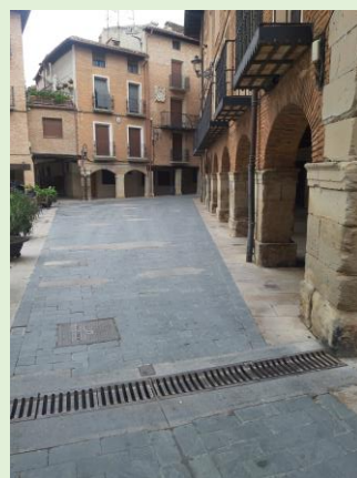
Plaza de Santa María